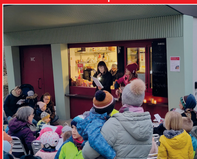
Geschichtenzeit auf dem Spielplatz Kyburgpark