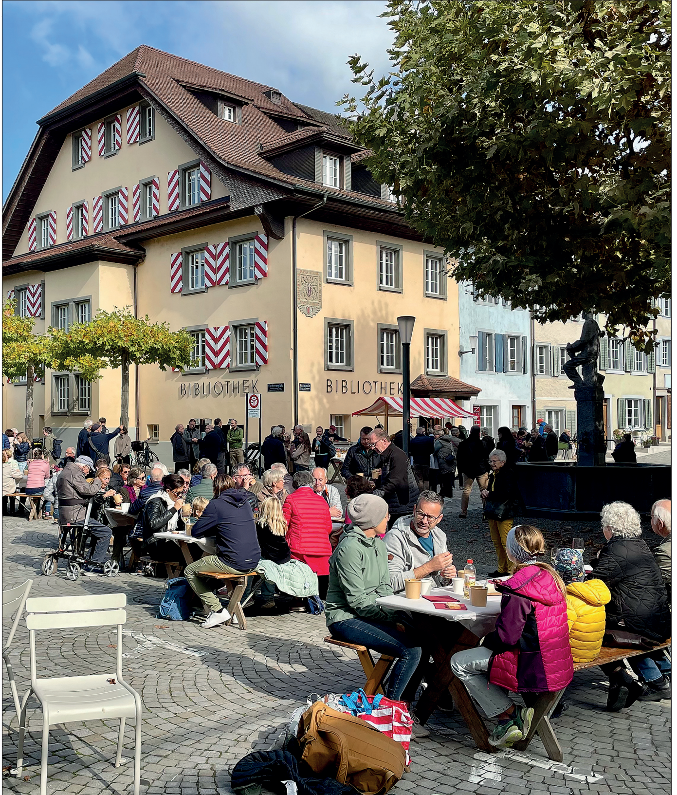
Eröffnung Open Library