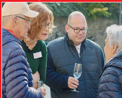
Eröffnung Open Library